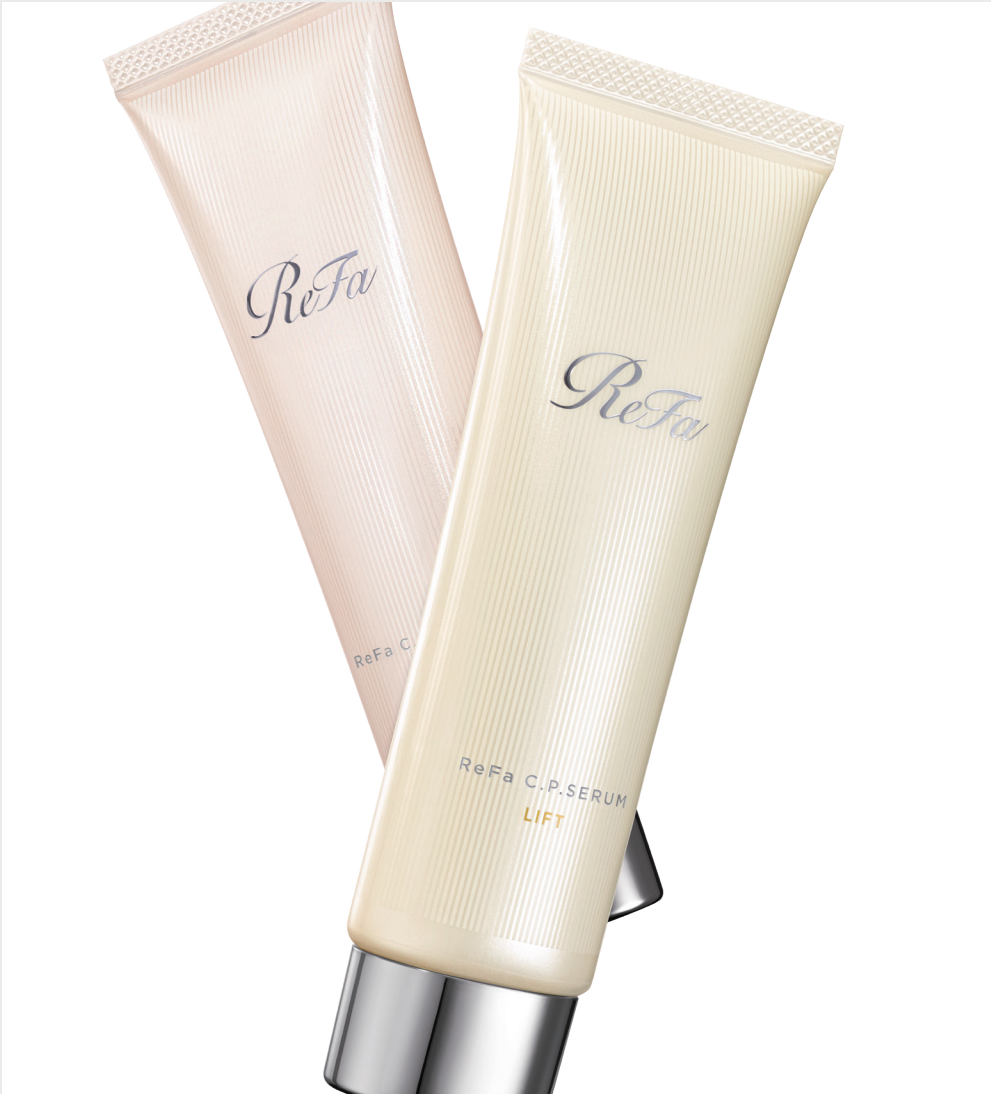
ReFa C.P.SERUM LIFT ReFa C.P.SERUM GLOW